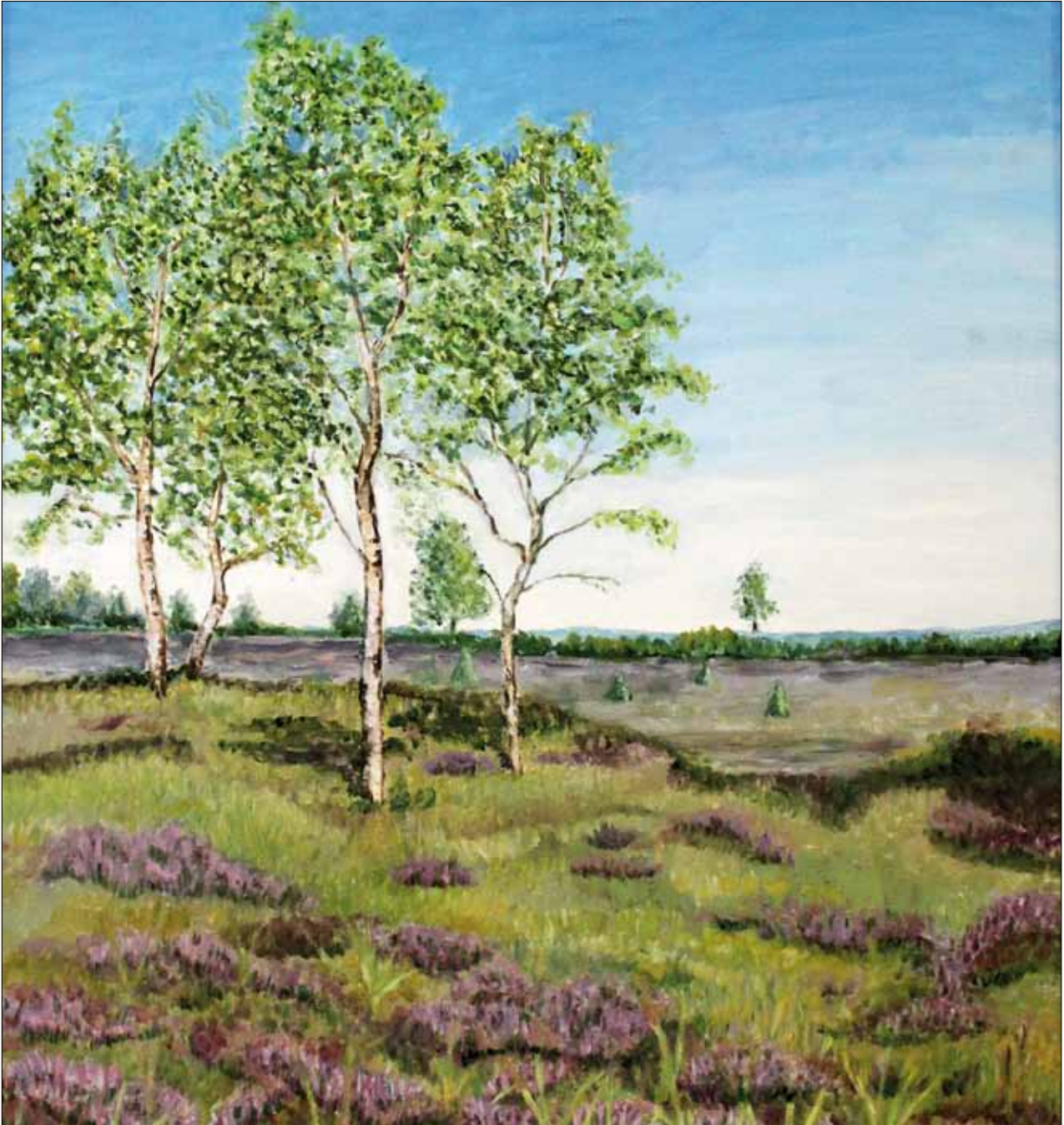
Mathilde Lummer: „Heidelandschaft bei Paderborn“, Öl auf Leinwand