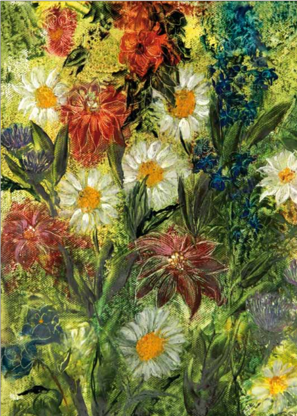
Gerlinde Steenbeck: „Sommer“, Encaustic