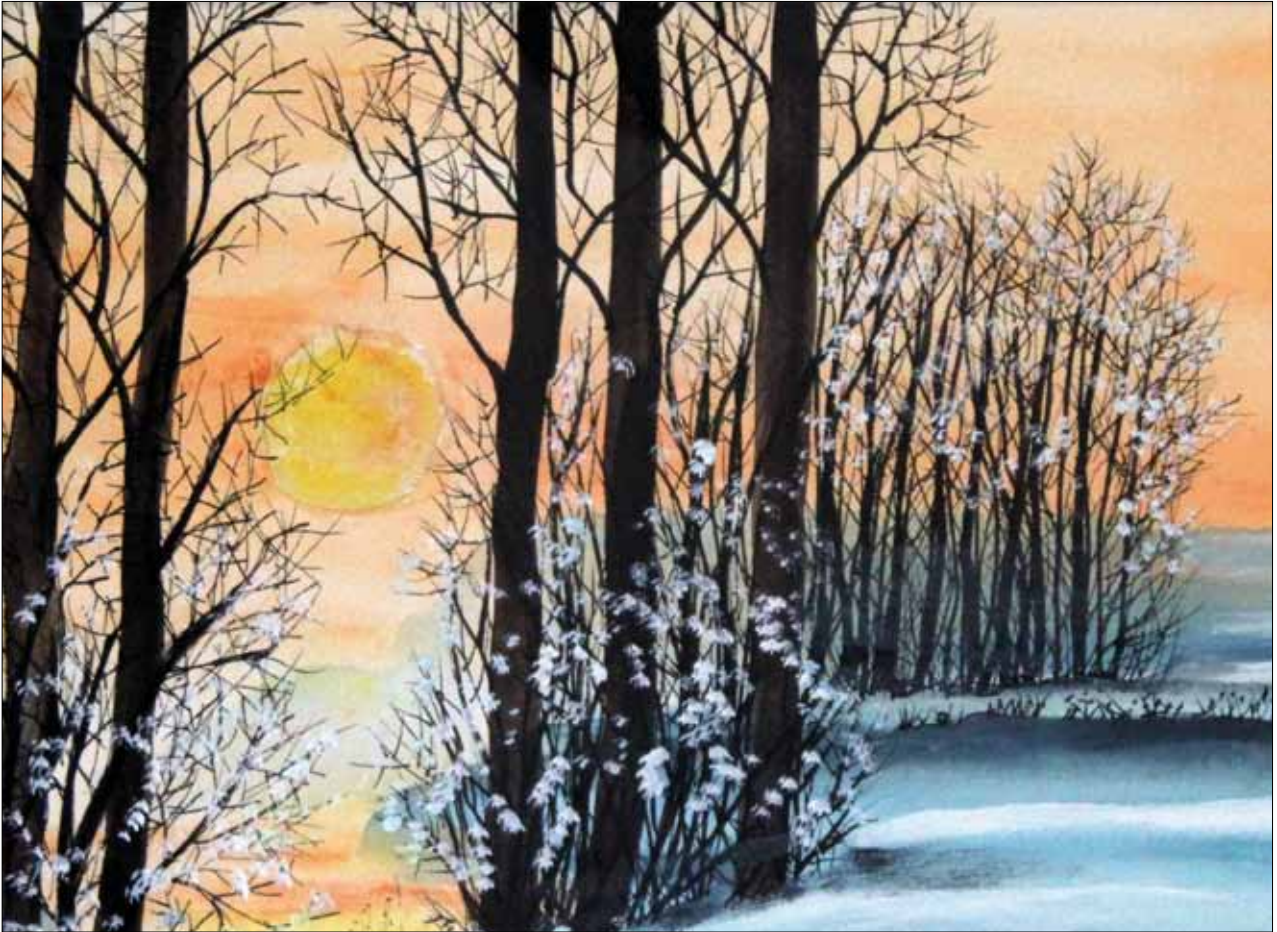
Ruth Jäger: „Winterlandschaft“, Gouache, Tusche