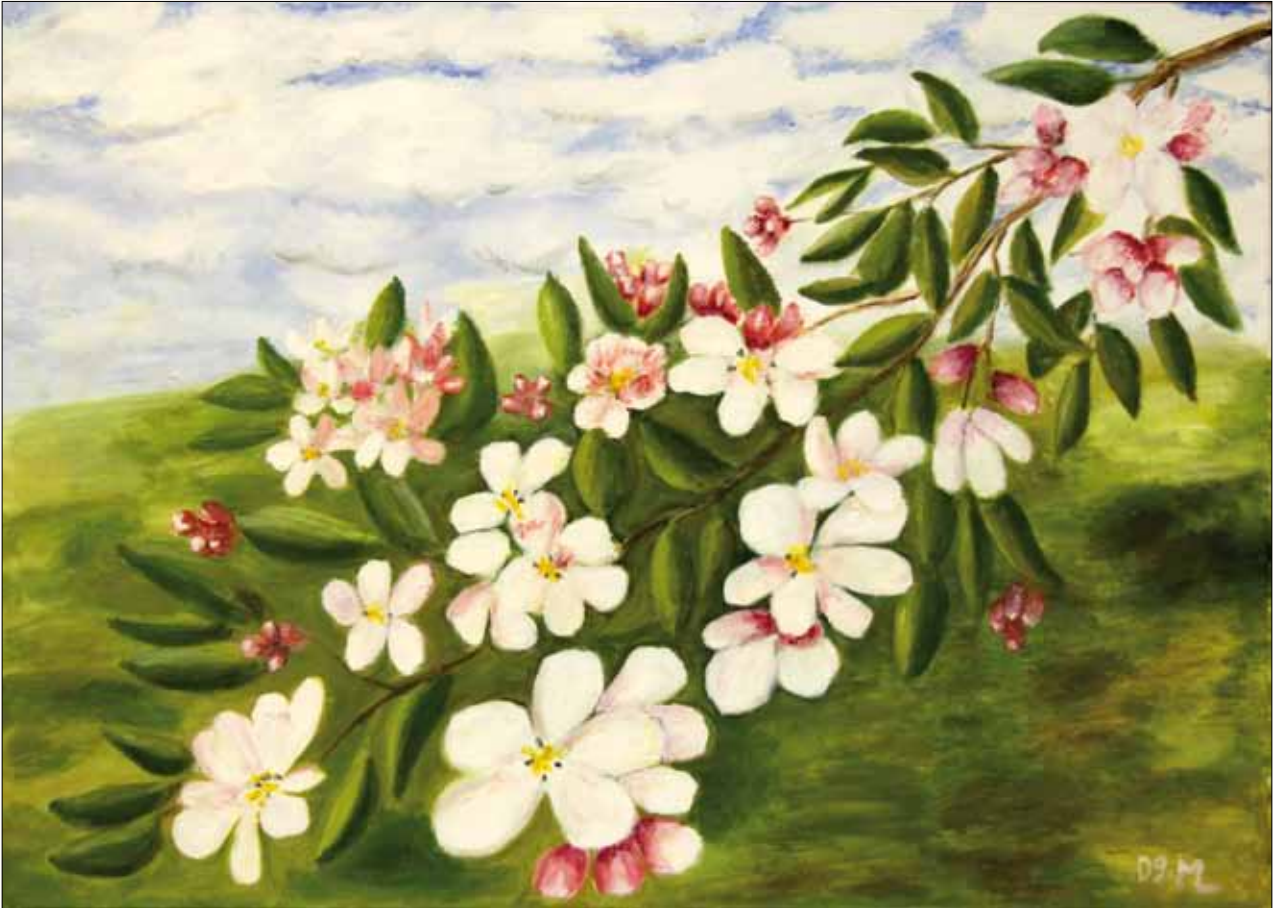
Margarete Lummer „Apfelblütenzweig“, Öl auf Leinwand