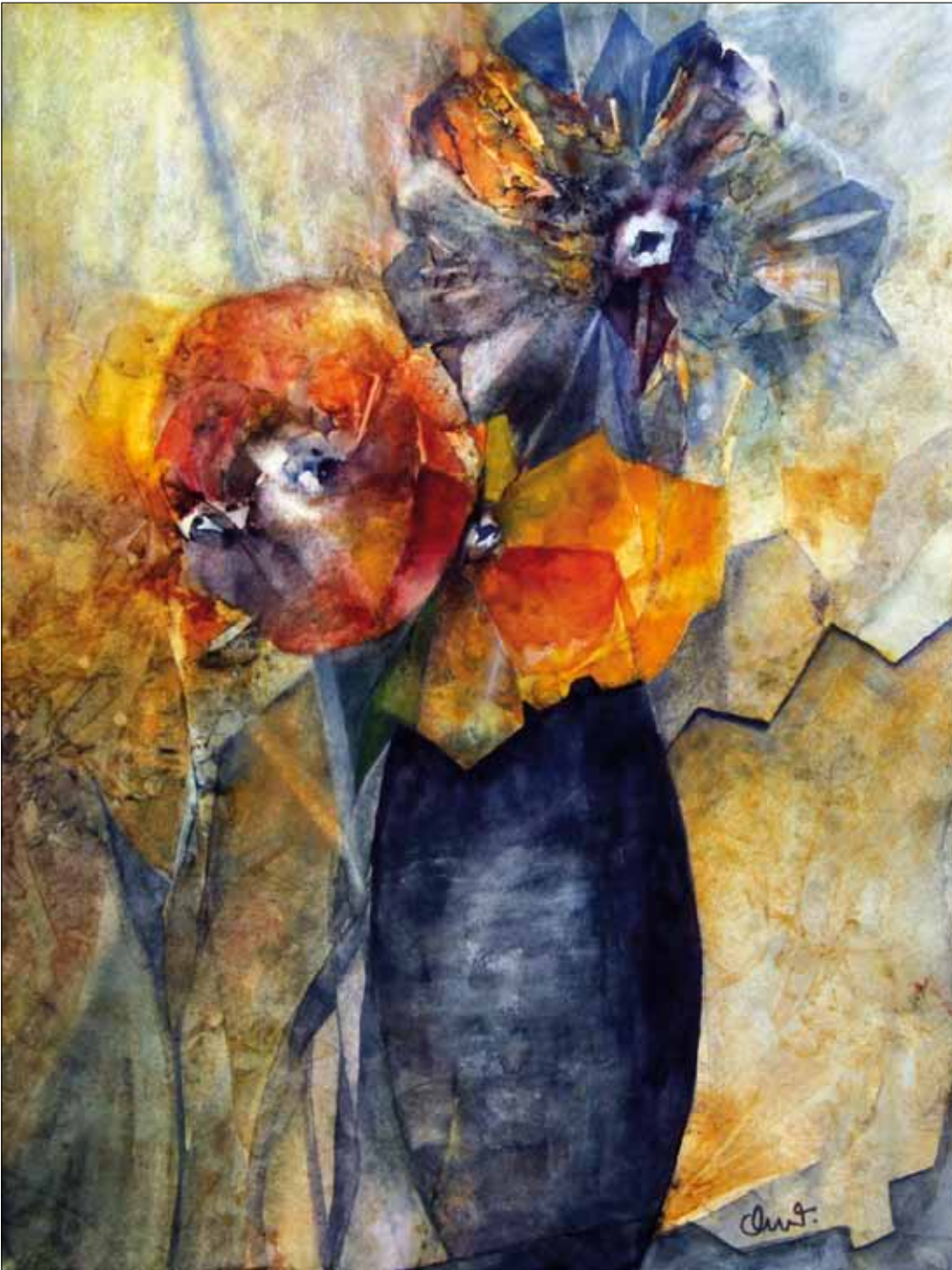
Christel Wrobel „Farbenspiel mit Blüten“, Aquarell